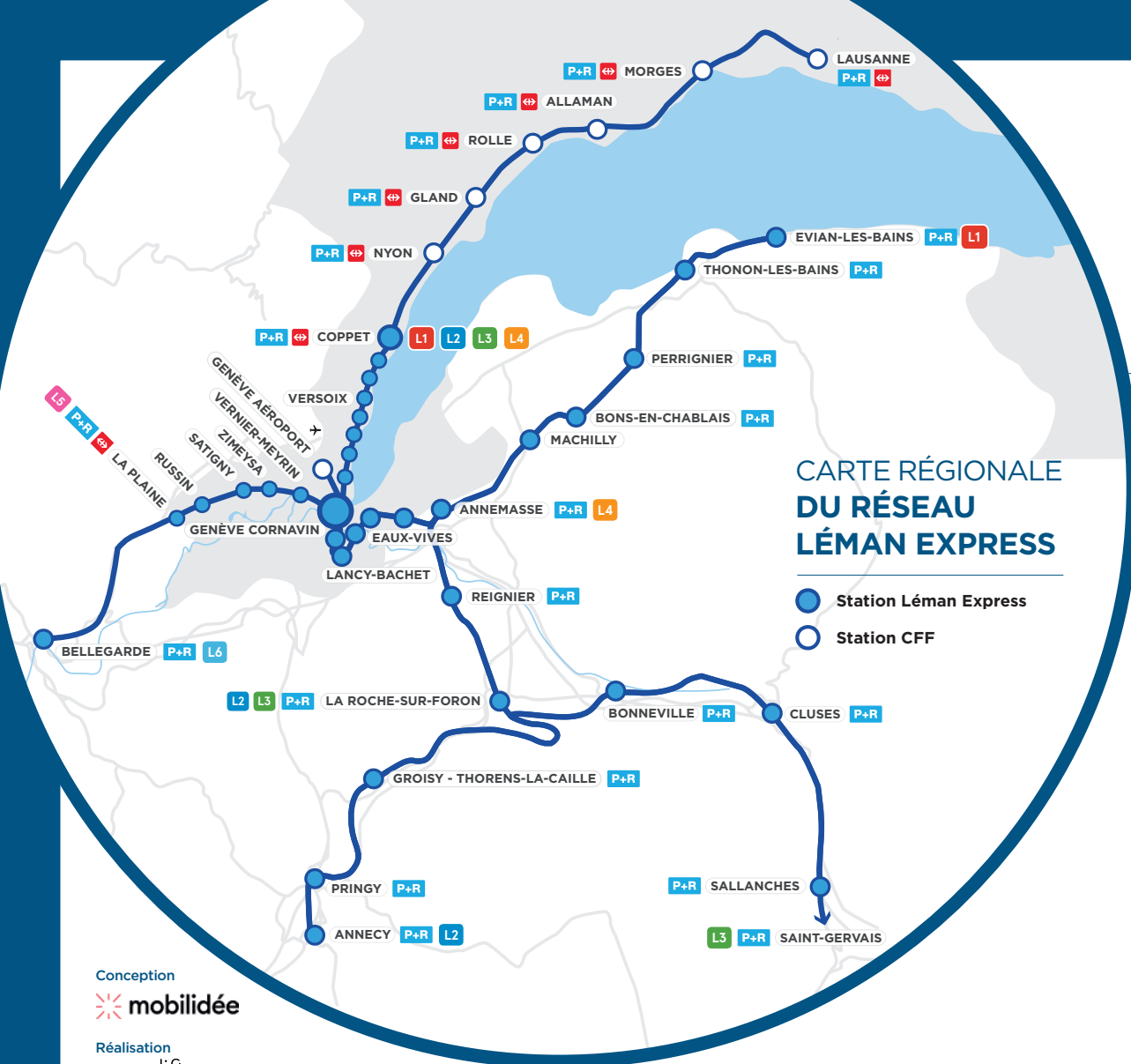
CARTE RÉGIONALE DU RÉSEAU LÉMAN EXPRESS

70'000 COLLABORATEURS/TRICES DES ZONES INDUSTRIELLES POTENTIELLEMENT CONCERNÉ(E)S